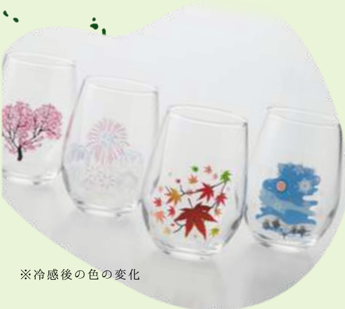
※冷感後の色の変化