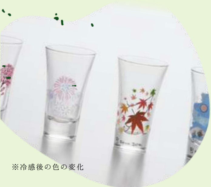
※冷感後の色の変化